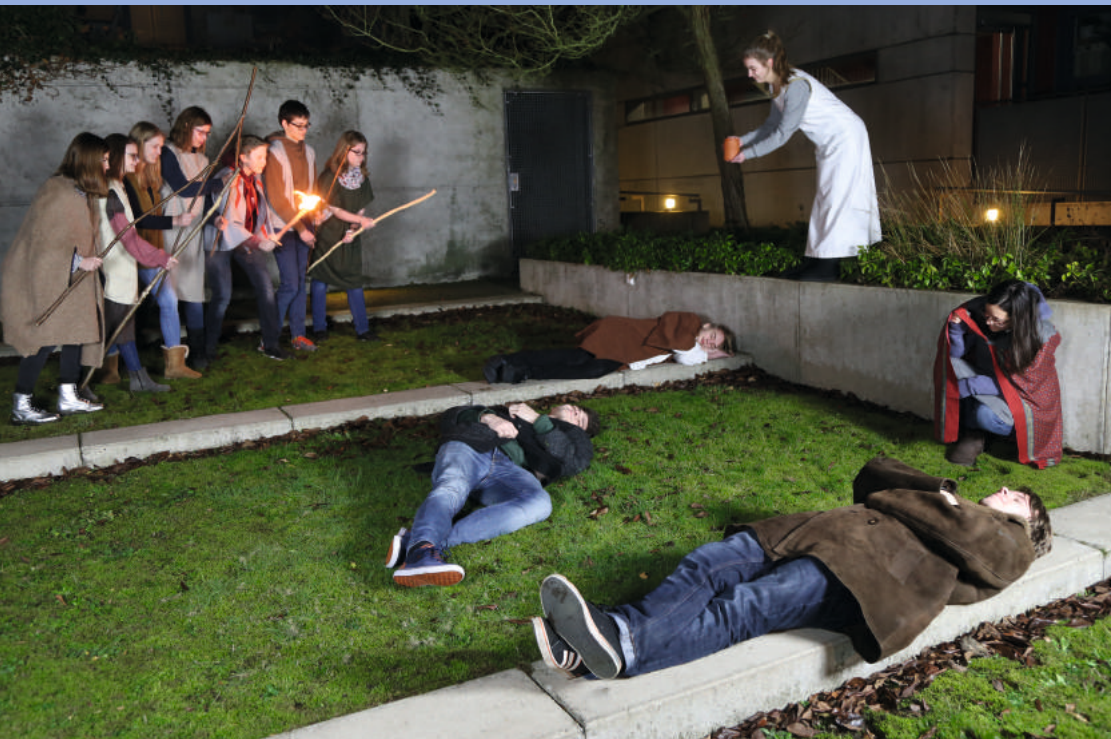
Die Bilder sind im Kreuzgang im Kirchenzentrum Kronsberg zu sehen.