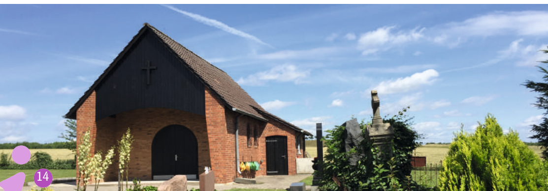
Friedhofskapelle Wülferode bekommt neue Lautsprecheranlage