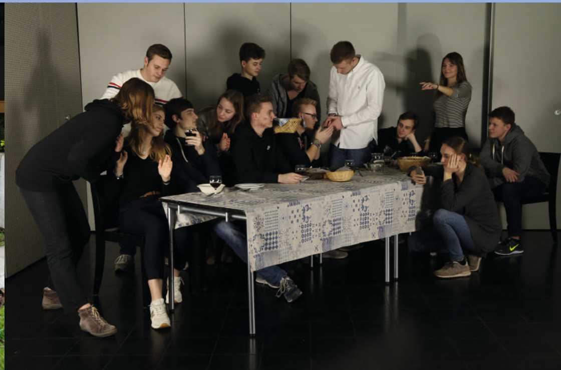
Die Bilder sind im Kreuzgang im Kirchenzentrum Kronsberg zu sehen.

Auch hier sind die finsternen Gestalten mit einer Fackel zu sehen, die Böses wollen. Aber wir beten nicht alleine.