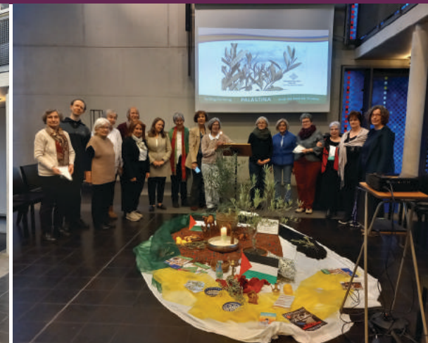
Weltgebetstag im Kirchenzentrum