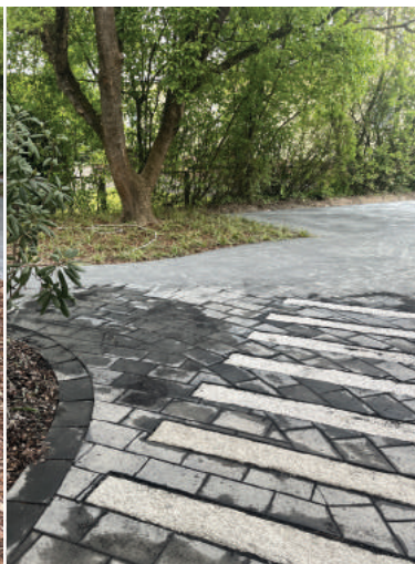
Zebrastrreifen – sicheren und trockenen Fußes in die KiTa!