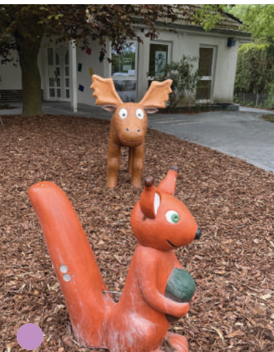
20 Eichhörnchen & Elch begrüßen künftig Klein und Groß!