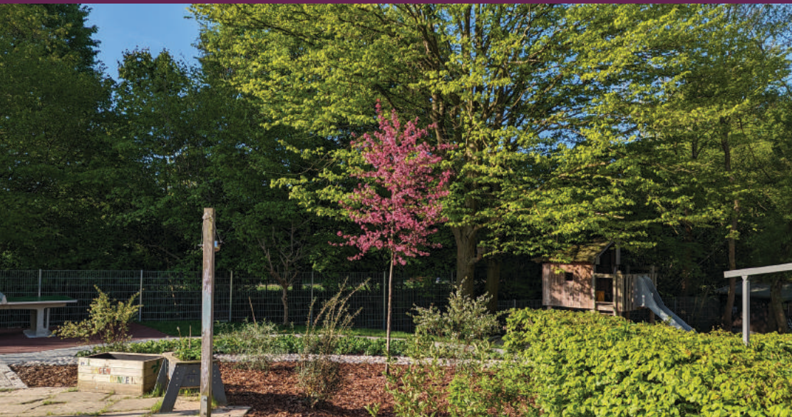
Der Frühling ist da!