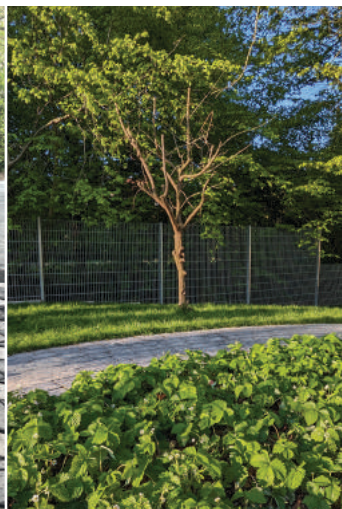
Hier wächst Köstliches für kleine Naschkatzen!