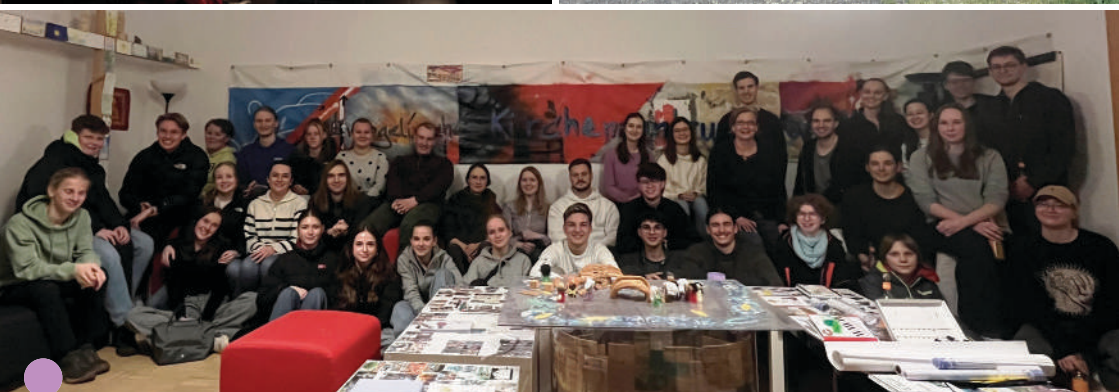
34 Entsandte: Nosis, die schon in die Welt entsandt sind, kamen zum Gespräch und Austausch zur Jugendgruppe zu Besuch.

Starker Regen machte alle Planung zunichte: Unter einer Unterführung feierten wir Gottesdienst, ein Anwohner reichte uns spontan Strom über eine Verlängerungskabel aus dem Fenster, wo E-Piano und CoffeeBike angeschlossen werden konnten. Bei starkem Regen hatte der Osterhase doch einige Eier versteckt – überraschend viele Menschen versammelten sich und hörten die Ostergeschichte. Wir sangen zusammen und Frau Meisig von der Katholischen Gemeinde spielte auf dem E-Piano: Gute Stimmung trotz starkem Regen. Danach stärkten wir uns am Gastgeber-CoffeeBike, Kinder suchten Ostereier. Wunderbar!