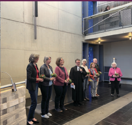
Dank an die vorbereitenden Ehrenamtlichen bei der ökumenischen Bibelwoche