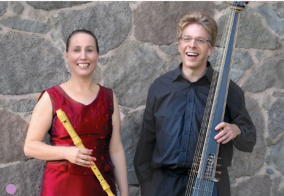
12 Duo La Vigna konzertiert in der Wülferoder Kapelle