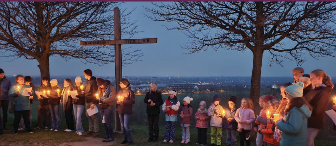
Auf dem Berg läuteten dann die Kinder der Kinderkirche ihre Glocken zu Ostern Die Jugendgruppe hat die Osternacht gemeinsam im Kirchenzentrum verbracht