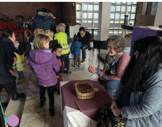
16 Brot und Traubensaft für die KiTa-Kinder