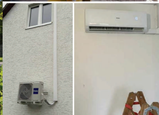
Neue Fenster und eine Klimaanlage sorgen zukünftig für ein gutes Raumklima im neuen Gruppenraum!