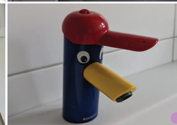
Das wird ein schöner Waschraum – mit liebevollen Details!